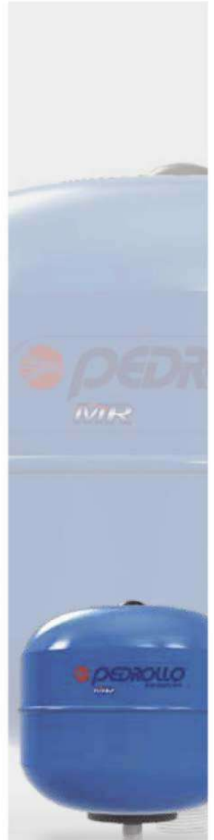
VERTICALES Tanques Pedrollo DF Diafragma Fijo Máxima presión de trabajo 10 BAR (145 PSI) De 50 a 600 L