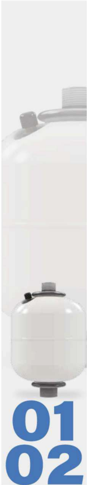
FLO Tanque especial para velocidad variable Máxima presión de trabajo 10 BAR (145 PSI) 3 L