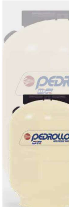
HORIZONTALES Tanques Pedrollo DF Diafragma Fijo Máxima presión de trabajo 10 BAR (145 PSI) De 24 a 80 L